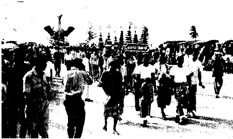
ขบวนดนตรี ขบวนบุหงาซีอริ และขบวนนกของอำเภอยะรัง กำลังเคลื่อนขบวนเข้าสู่บริเวณ เมืองปัตตานีเมื่อปี พ.ศ. ๒๕๑๑