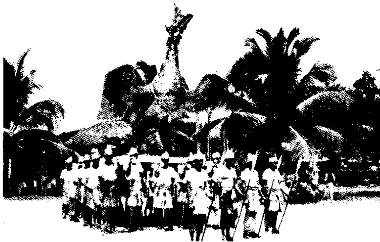
ภาพขบวนทอ