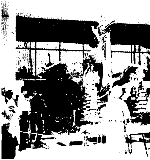
ภาพการทำพิธีสวมหัวนกกาฆะสุร ผู้เขียน (ซ้ายสุด) กำลังสังเกต การทำพิธีสวมหัวนก ในการจัดขบวน แห่ใน ปี พ.ศ. ๒๕๐๑ ของอำเภอยะรัง