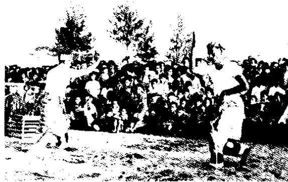
ลีละกำลังรำรำให้ผู้ชมดู

ต่อจากขบวนนก ก็เป็นขบวนพลกริช ขบวนพลทอ ผู้คนในขบวนแต่งกายอย่างนักรบสมัยโบราณ ถือทอ ถือกริชเดินตามหลังขบวนนก ดุจเหล่าทหารหาญ เคลื่อนเข้าสู่สมรภูมิมิอันมีพระราชเป็นผู้นำ จำนวนทหารกริช ทหารทอมีมากเท่าไรก็ จะทำให้ขบวนหนักแลดูน่าเกรงขามมากยิ่งขึ้น