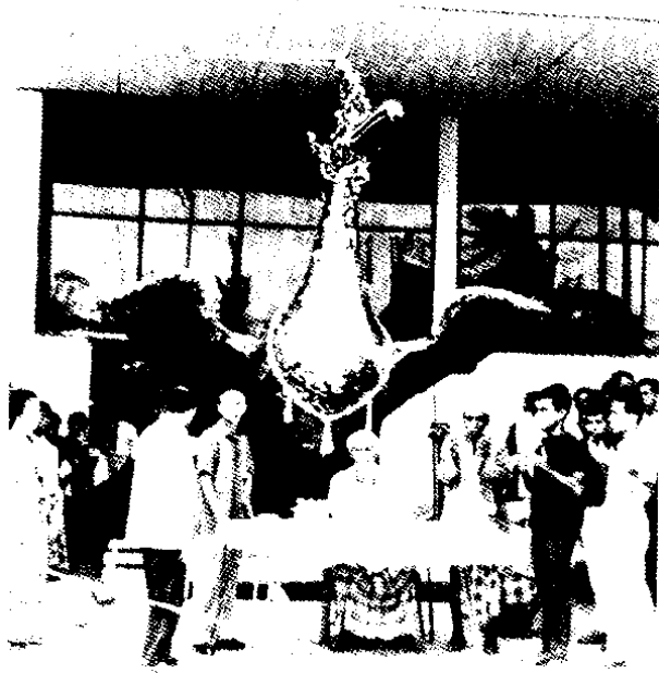
ภาพพิธีสวมหัวนกกาสุร (กาหะสุร) ตอนสวดขอพรเพื่อบรรลุความสำเร็จและ เกิดความสวัสดีมงคลแก่ผู้ร่วมงาน