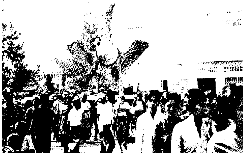
ขบวนนาของอำเภอยะรังกำลังเคลื่อนเข้าสู่อำเภอเมืองปัตตานี