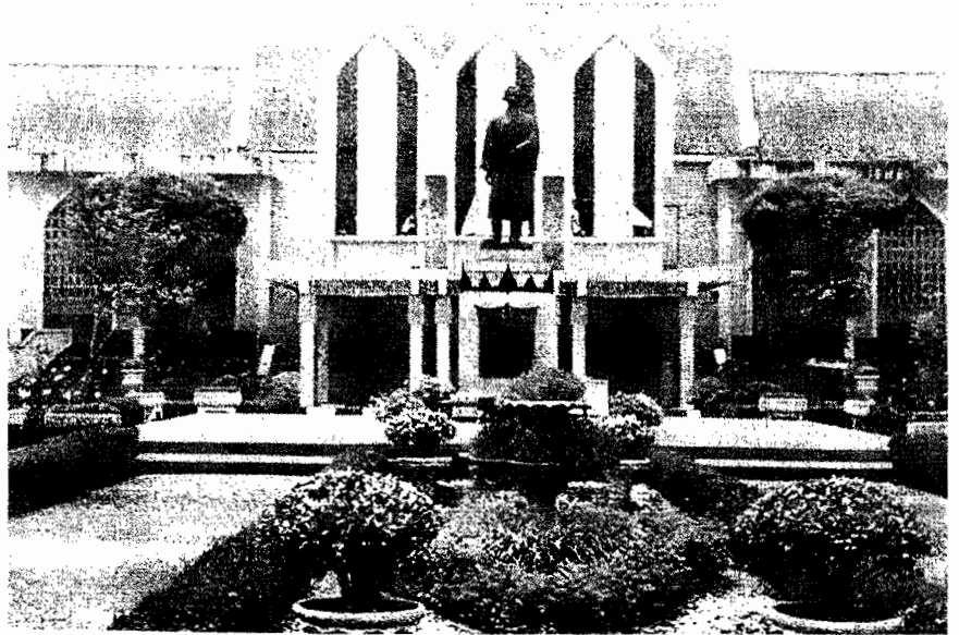
ลานพระบิดา ภายในมหาวิทยาลัยสงขลานครินทร์ วิทยาเขตปัตตานี

พอถึงสถานีรถไฟโคกโพธิ์ตอนรุ่งเช้าก็มีรถบัสของมหาวิทยาลัย 2 คัน มา