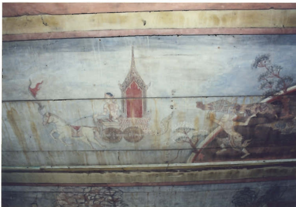
ภาพจิตรกรรมเรื่องมขมาณพ