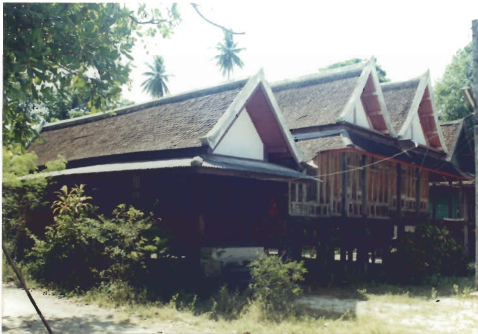
กุฏิไม้ทรงไทยสามหลัง

ลักษณะกุฏิเป็นเรือนแฝดสร้างตามทิศเหนือทิศใต้และมีเรือนขวางทิศตะวันตกอีก ๑ หลัง ภายในมีการแกะสลักไม้ลวดลายสวยงามเป็นศิลปะแบบจีน ไทยพุทธ ไทยมุสลิม มีลายดอกไม้ ภาพสัตว์ กรอบประตูแกะเป็นนายทวารบาล ที่คอสองเพดาน ระเบียงและฝาผนังมีภาพจิตรกรรมพุทธประวัติและชาดกเขียนด้วยฝีมือช่างพื้นบ้าน