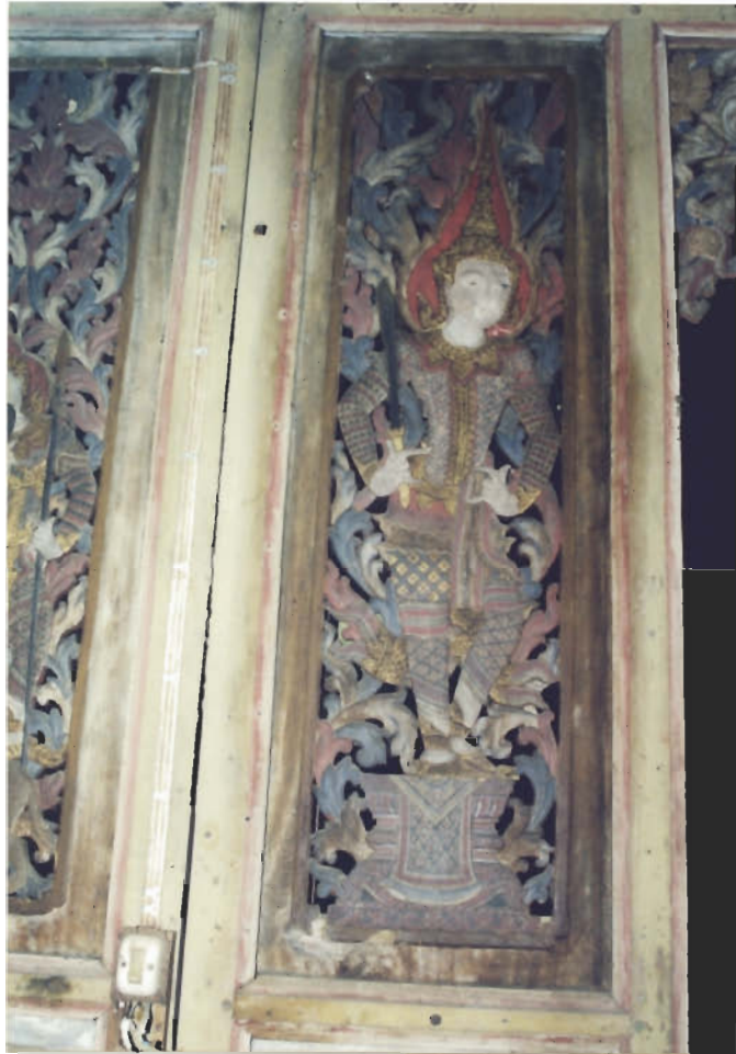
ไม้แกะเป็นรูปนาย ทวารบาล