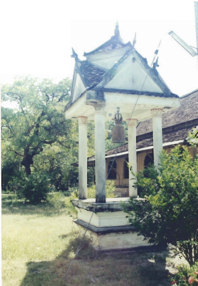
๖. หอระฆัง สร้างเมื่อ พ.ศ. ๒๕๑๔ โดยพ่อขุนรักษ์