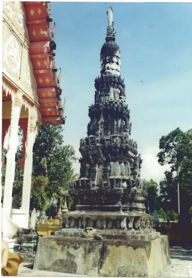
พระปรางค์หลังอุโบสถ

วางศิลาฤกษ์เมื่อวันที่ ๒๗ มกราคม พ.ศ. ๒๕๑๔ อำนวยการสร้างโดยพระครูสุทธิกาญจนภาส โครงสร้างทรงไทยแบบคอนกรีตเสริมเหล็กขนาดกว้าง ๗.๕๐ เมตร ยาว ๑๗.๕๐ เมตร หลังคา ๓ ชั้น หน้าบันมีพระปรมาภิไธยย่อ ภปร. หน้าประตูอุโบสถมีรูปยักษ์ถือกระบองเฝ้าประตู อุโบสถแห่งนี้สร้างเมื่อปี พ.ศ. ๒๕๒๐ พระบาทสมเด็จพระเจ้าอยู่หัวภูมิพลอดุลยเดช เสด็จพร้อมด้วยสมเด็จพระเทพรัตนราชสุดาฯ ทรงยกช่อฟ้าอุโบสถวัดหงสาวรามวันที่ ๒๐ กันยายน พ.ศ. ๒๕๒๐