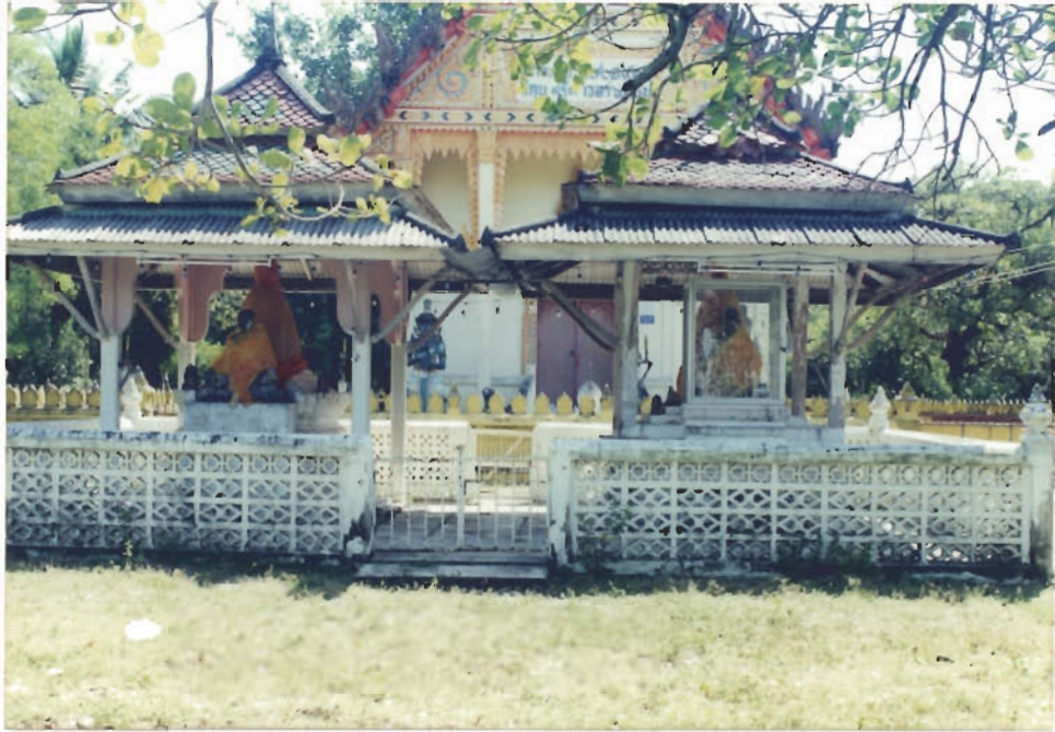
ศาลาสถูปบรรจจุลฐิและรูปเหมือนอดีตเจ้าอาวาส

ไม่ปรากฏปีที่สร้าง แต่สร้างขึ้นในสมัยพระครูสุทธิกาญจนภาส ภายในมีสถูปบรรจจุลฐิและรูปเหมือนพระปลัดแดง อินทวิไล และพระครูพุทธวิรากร (ยก พุทธวีโร)