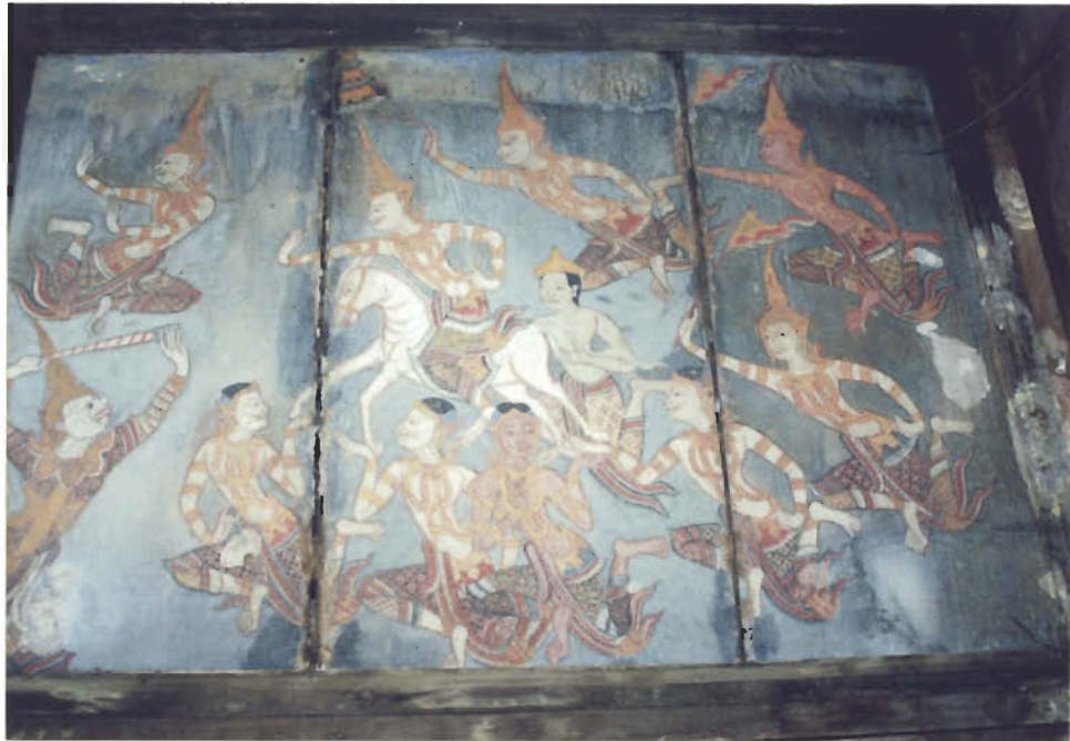
ภาพจิตรกรรมพระพุทธประวัติ ตอนเจ้าชายสิทธัตถะเสด็จออกผนวช