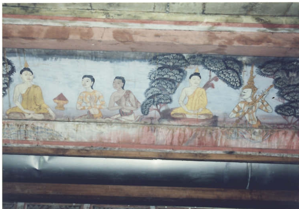
พระอินทร์ทรงตีพิณสามสาย ถวายพระพุทธเจ้า