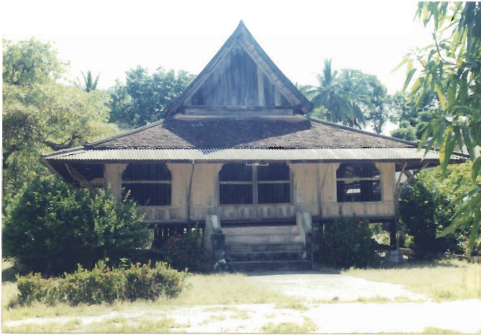
โรงเรียนศาลา