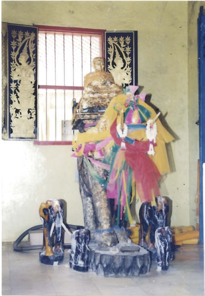
รูปเหมือนภายในวิหาร สมเด็จพระหลวงพ่อทวด