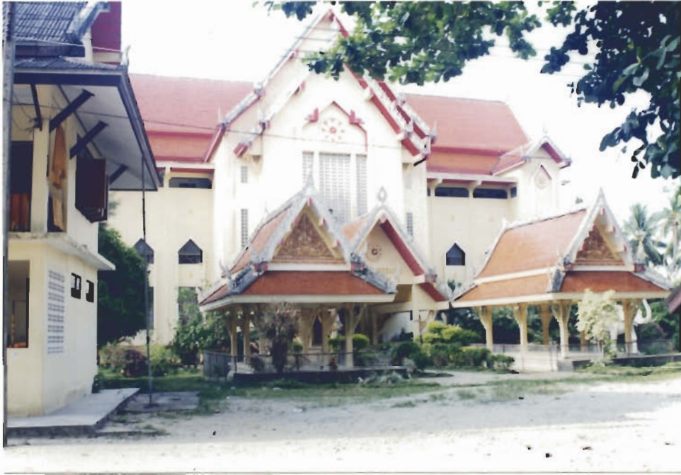
โรงเรียนพระปริยัติธรรมและศูนย์พุทธศาสนาวันอาทิตย์