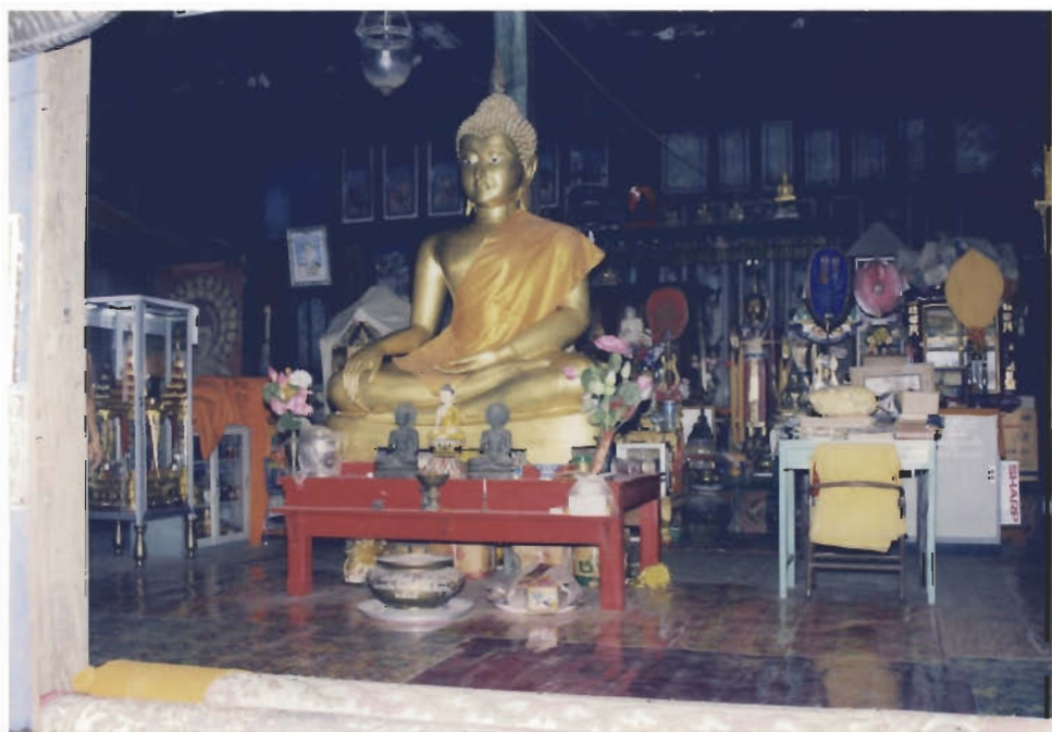
พระพุทธรูปภายในกุฏิไม้หลังใหญ่