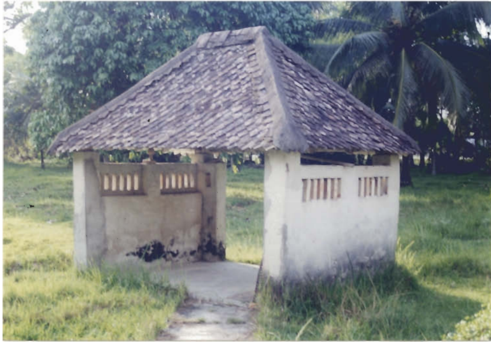
ศาลาพักศพ

ไม่ปรากฏปีที่สร้าง หลังใหญ่เป็นศาลาคอนกรีตมุงด้วยกระเบื้องดิน พื้นทำด้วยคอนกรีตเสมอพื้นดินใช้เป็นสถานที่ประกอบพิธีในงานฌาปนกิจศพภายในศาลามีภาพจิตรกรรมเรื่องพระมาลัยโปรดสัตว์นรกและบรรยายสัตว์นรกประเภทต่าง ๆ หลังเล็กศาลาพักศพ ในช่วงทำพิธีสงฆ์