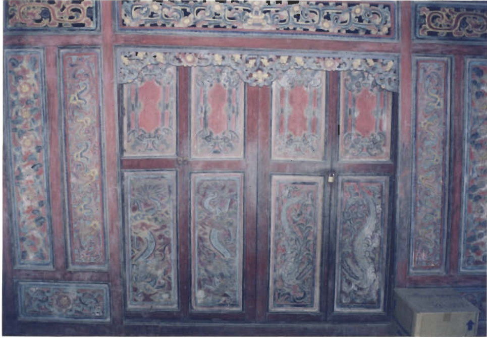
ไม้แกะสลักลวดลายจีนภายในกุฏิไม้หลังใหญ่