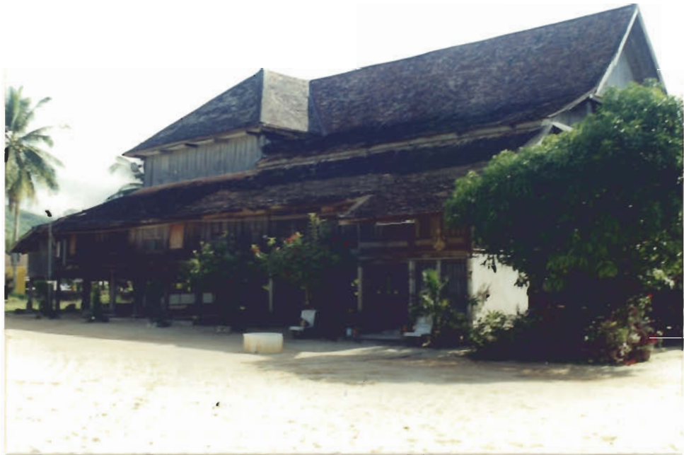
กุฏิไม้หลังใหญ่