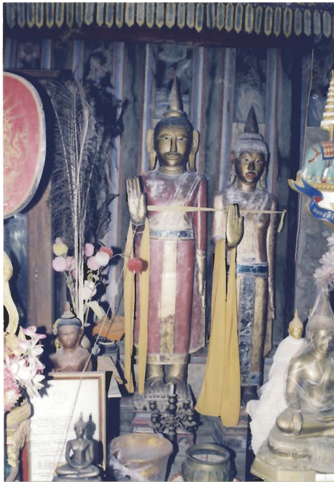
พระพุทธรูปไม้ปางห้ามญาติ ๒ องค์ใช้ในประเพณีชักพระเดือน ๕

ทำด้วยไม้ ๒ ตัว ภายในบุษบกประดิษฐานพระพุทธรูปปางห้ามญาติ ๒ องค์ เวลาเช้าของวันแรม ๑ ค่ำ เดือน ๕ ชาวบ้านจะช่วยกันชักลากเรือพระออกจากวัดไปตามเส้นทางประมาณ ๑ กิโลเมตร ถึงศาลาพักร้อนริมทางและทำพิธีสมโภชเรือพระที่นั่นศาลาริมทาง ถวายภัตตาหารเพลและร่วมรับประทานอาหารเที่ยง มีการเล่นสนุกสนานกัน พอตอนเย็นจะช่วยกันชักลากเรือพระกลับมายังวัด