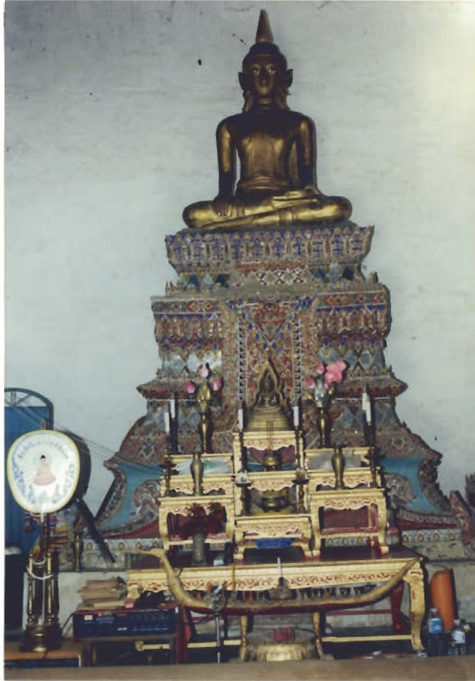
พระประธานในอุโบสถ

ช่างฝีมือพื้นบ้าน ประดิษฐานบนบัลลังก์มีกนกลายปูนติดกระจกสีลักษณะการ ประดับประดาคล้ายกับวัดในอำเภอตากใบ อุโบสถหลังนี้บูรณะแล้ว ๒ ครั้ง หน้า อุโบสถมีรูปปั้นยักษ์ ๒ ตนยืนกุมกระบองเฝ้าประตู