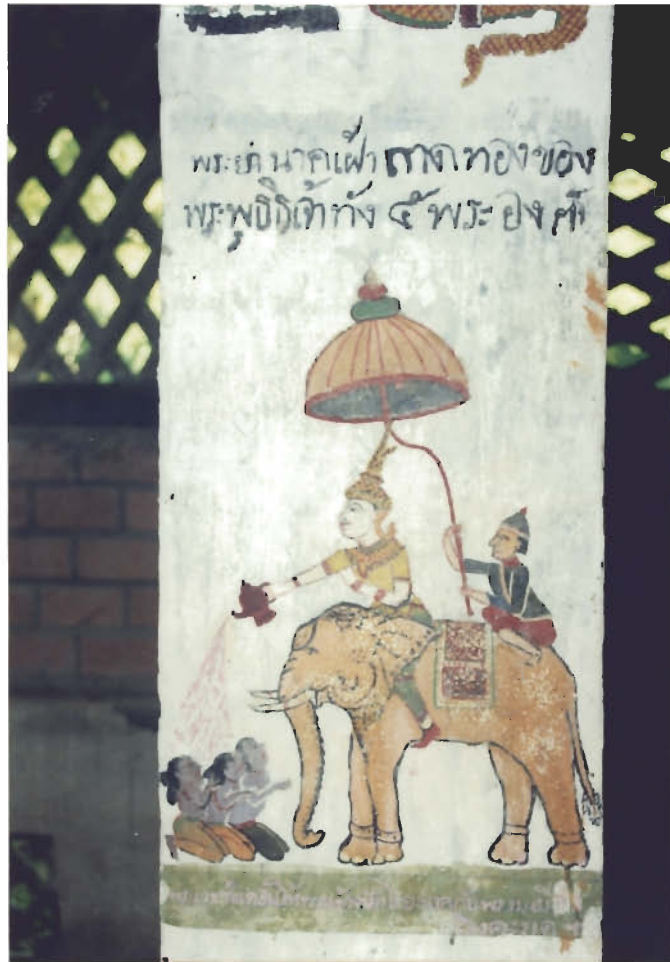
ภาพจิตรกรรมพระเวชสันดรและเรื่องราวเกี่ยวกับพระพุทธศาสนา