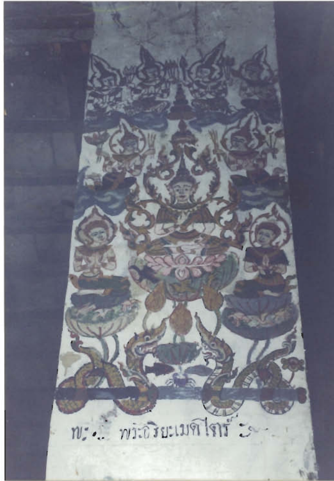
ภาพจิตรกรรมพระเวชสันดรและเรื่องราวเกี่ยวกับพระพุทธศาสนา