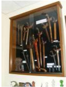
กริชรูปแบบชาวฟิลิปปินส์ มาเลเซีย และกริช รูปแบบปัตตานี

การเป็นเมืองท่าที่สำคัญของเมืองปัตตานีที่อยู่ในเส้นทางการค้านี้เองทำให้เกิดการแลกเปลี่ยนวัฒนธรรมในรูปแบบต่าง ๆ มากมาย รวมถึงวัฒนธรรมการใช้กริชของชาวอินโดนีเซียที่เข้ามาทำการค้าในแถบนี้ด้วย จะเห็นได้จากการพบกริชในรูปแบบอินโดนีเซียในแถบนี้ ถึงแม้ผู้คนในดินแดนทางตอนใต้ของไทยจะรับเอาวัฒนธรรมการใช้กริชมาจากอินโดนีเซียหรือชวาก็ตาม