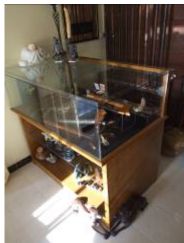
ภาพกริชในพิพิธภัณฑ