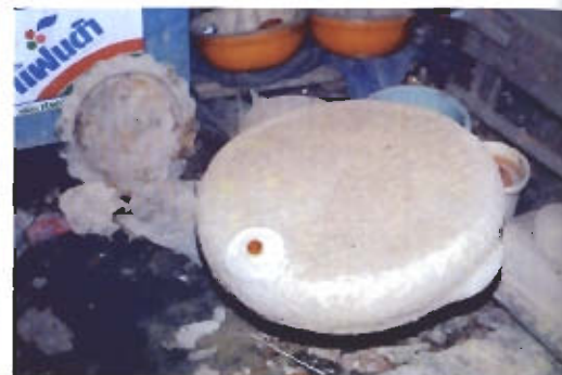
● หุ่นแม่พิมพ์กระทงบนบ่อเปิดที่เสร็จเรียบร้อยแล้ว วางทิ้งไว้ให้แห้งเตรียมสำหรับเอาขึ้นฟองออก เพื่อเทน้ำทองเหลือง จะเห็นรูบนวนสำหรับเททองเหลือง