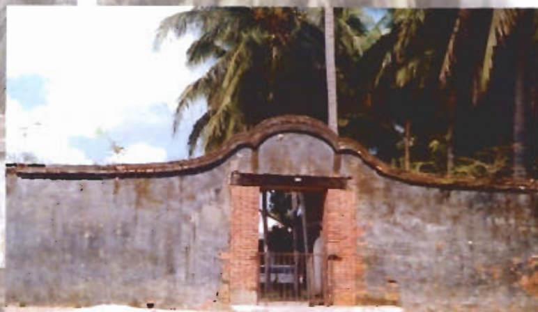
● ภาพหมู่บ้านจะบังติกอ

ในรัชสมัยสมเด็จพระนั่งเกล้าเจ้าอยู่หัว รัชกาลที่สามแห่งกรุงรัตนโกสินทร์ ตนกุปะสา เชื้อพระวงศ์เมืองกลันตัน ได้รับการแต่งตั้งให้เข้ามาเป็นเจ้าเมืองหนองจิกในปี พ.ศ.2385 และในปี พ.ศ.2388 ตนกุปะสาได้รับการแต่งตั้งให้มาเป็น เจ้าเมืองปัตตานีแทนตำแหน่งเจ้าเมืองคนก่อนที่ว่างลง ในการเดินทางจากกลันตันเข้ามาเป็นเจ้าเมืองหนองจิก และเจ้าเมืองปัตตานีในครั้งนั้น ท่านได้อพยพไพร่พล บริวารติดตามเข้ามาเพื่อสร้างบ้านแปงเมืองเป็น จำนวนถึง 1,388 ครอบครัวมีจำนวนคนถึง 6,800 คนเศษ การอพยพเข้ามาในครั้งนั้นมีช่างฝีมือแขนง ต่างๆ ได้แก่ ช่างไม้ก่อสร้าง ช่างไม้แกะสลักประดับ ตกแต่งอาคาร ช่างทอผ้าชั้นสูง ช่างทองรูปพรรณ ช่างทำเครื่องทองเหลืองเข้ามาด้วยจำนวนหนึ่ง ช่าง ฝีมือเหล่านี้เป็นช่างฝีมือชาวกลันตันและศรีลังกา จึงพบวางานศิลป์ทั้งหลายของเมืองปัตตานี สมัย ต้นรัตนโกสินทร์ในรัชสมัยรัชกาลที่ 3 เป็นต้นมาจะมี รูปแบบเดียวกันกับงานช่างศิลป์ของเมืองกลันตัน และศรีลังกา