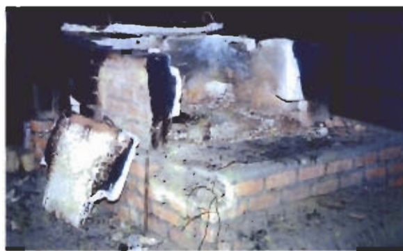
● รูปแบบเตาหลอมทองเหลืองที่บ้านของคุณเวอาบ: เป็นเตาโอ: ช่างทำเครื่องเหลืองแห่งบ้านจะบังติกอ จะใช้ถ่านไม้เป็นเชื้อเพลิง

เมื่อจะทำการเททองเหลือง ก็จะต้องนำหุ่นที่แห้งดีแล้วไปเผาไฟสักรอกเอาซีเมนต์ออกให้หมดแล้วจึงเทน้ำทองเหลืองเข้าแทนที่ในช่องว่างที่ซีเมนต์ได้ละลายตัวสักรอกออกไป โดยเทน้ำทองเหลืองเข้าไปทางรูขนวนจนน้ำทองเหลืองล้นออกมาทางรูระบายซึ่งแสดงว่าทองเหลืองเข้าไปแทนที่ในช่องว่างของซีเมนต์เต็มแล้ว ทิ้งหุ่นแม่แบบไว้จนเย็นจากนั้นจึงทำการทุบแม่แบบดินเหนียวออกก็จะได้ชิ้นงานทองเหลืองตามต้องการ จากนั้นจึงตัดขนวนและขัดแต่งผิวชิ้นงานให้เรียบ แล้วจึงนำวางขายให้กับลูกค้าหรือผู้ที่มาซื้อต่อไป