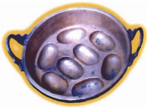
● แม่พิมพ์อบขนมไข่

ประโยชน์ใช้สอย เป็นภาชนะมีฝาปิดสำหรับใช้ใส่ของ เช่นของมีค่าชิ้นเล็ก ๆ จำพวกเครื่องทอง หรือใส่อาหารได้แก่อาหารแห้ง จำพวกขนมหวานและของ ขบเคี้ยวต่าง ๆ