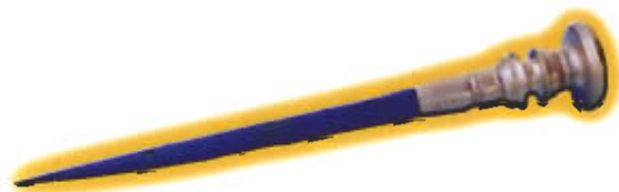
● หลักล่าบวัว

ประโยชน์ใช้สอย ใช้เป็นหลักผูกถ่วงวัวชน เมื่อนำวัวไปชนตามบ่อนต่าง ๆ หลักที่สวจะช่วยเสริมบารมีให้กับวัวและเจ้าของวัวชนตัวนั้น ๆ ได้มากที่สุดทีเดียว