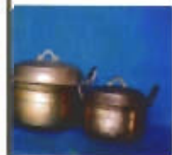
เครื่องทองเหลือง

ในขั้นแรกจะทำการปั้นแกนหุ่นของชิ้นงานด้วยแกนดินเหนียวผสมทรายละเอียดตาม อัตราส่วนเพื่อเป็นแกนชิ้นในของหุ่น ชิ้นต่อมาจะเป็นปั้นขึ้นตั้ง (ปัจจุบันใช้พาราฟินแทน) นำมาปิดพอกหุ้มแกนดินเหนียว โดยตกแต่งรายละเอียดของขึ้นตั้งให้มีความหนาและรูปทรงเหมือนกับชิ้นงานที่ต้องการแล้วจึงตัดขึ้นตั้งขึ้นและรื้อระบาย