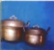
เครื่องทองเหลือง