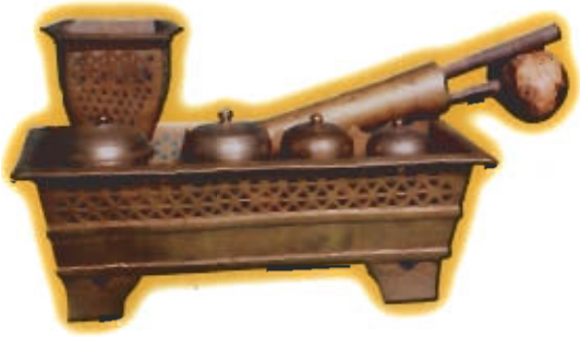
● ชุดเขี่ยนหมาก เขี่ยนราง

ประโยชน์ใช้สอย ใช้ใส่หมากพลูสำหรับไว้กินในครัว เรือน หรือไว้รับแขกที่มาเยี่ยมเยียนหรือมาธุระ เขี่ยนหมากชนิดนี้เป็นศิลปกรรมแบบมลายู