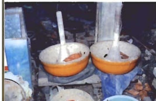
● แม่พิมพ์หรือหุ่นขี้ผึ้งของกระทงทองเหลือง ที่เตรียมนำขึ้นแท่นกลึงตอกแต่งรายละเอียด