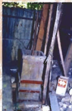
● เครื่องสูบลมที่ใช้ไฟฟ้าเพื่อความร้อน ยังคงใช้สูบลมแบบโบราณอยู่