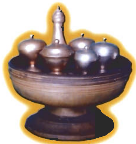
● เรียงกลิ้ง เรียงดิน