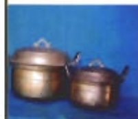
เครื่องทองเหลือง

อย่างไรก็ตาม การปรับเปลี่ยนทิศทางการผลิตดังกล่าวนี้ จำเป็นต้องอาศัยการสนับสนุนจากหน่วยงานทั้งภาครัฐและภาคเอกชน ไม่ว่าจะเป็นการให้ความรู้และคำแนะนำเรื่องวัสดุ เครื่องมือเครื่องใช้ เทคนิค และวิธีการผลิตที่ทันสมัย การออกแบบผลิตภัณฑ์เงินทุน การตลาดและการประชาสัมพันธ์ เมื่อการผลิตเครื่องทองเหลืองฟื้นฟูจนคึกคักดังเช่นอดีต ช่างฝีมือก็สามารถดำรงอยู่ได้ ข้อสำคัญศิลปะการผลิตเครื่องทองเหลืองพื้นบ้านของช่างเอกแห่งปัตตานีได้รับการสืบสานและดำรงอยู่ในฐานะมรดกทางวัฒนธรรมของคนในชาติต่อไป