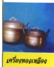
เครื่องทองเหลือง

จากคำบอกเล่าของลูกหลานช่างหล่อทองเหลืองในหมู่บ้านจะบังติกอระบุว่าบางครอบครัวต้นตระกูลดั้งเดิมเป็นชาวตรังมาก่อน แต่ส่วนใหญ่เป็นชาวกันตัน ซึ่งติดตามคนกูปะสาเข้ามาในฐานะช่างฝีมือทองในสมัยนั้น เมื่อคนกูปะสาได้รับการแต่งตั้งให้เป็นเจ้าเมืองปัตตานีและได้เลือกเอาทำเลบ้านจะบังติกอเป็นที่ตั้งวังเจ้าเมืองและเป็นศูนย์กลางการปกครองเมืองปัตตานีในยุคนั้น ช่างฝีมือแขนงต่าง ๆ ที่เป็นช่างหลวงมารวมตัวตั้งหลักแหล่งกันอยู่รอบ ๆ วังเจ้าเมืองเพื่อช่วยกันสร้างบ้านแปงเมืองให้กับเจ้าเมืองปัตตานีคนใหม่เช่นเดียวกับกลุ่มช่างฝีมือแขนงอื่น ๆ ช่างทำเครื่องทองเหลืองทั้งหลายที่เข้ามาในครั้งนั้นได้ตั้งหลักแหล่งอยู่ใกล้กับวังเจ้าเมืองเพื่อประกอบอาชีพหล่อเครื่องทองเหลืองขายให้กับชนชั้นสูงของเมืองปัตตานีและชาวเมืองทั่วไปในละแวกใกล้เคียงในภาคใต้ตอนล่าง