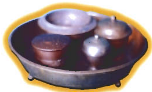
● เรียงดินข้าง

ชื่อ (ไทย) เขียน เขียนกลิ้ง เขียนดิน เขียนเชิง (มลายู) จรานอ จรานอซีระ