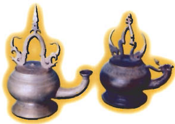
● ตะเกียงชวาลา

ประโยชน์ใช้สอย ใช้จุดเพื่อให้แสงสว่างและใช้ประกอบพิธีกรรมบางอย่างตามคติความเชื่อในท้องถิ่นโดยใช้น้ำมันมะพร้าวเป็นเชื้อเพลิง ใช้จุดตั้งพื้นหรือใช้ผูกกับขั้วฝาคะเกียงแขวนไว้ก็ได้ รูปแบบของขั้วฝาคะเกียงจะคล้ายกับขั้วเรือนแก้วของพระพุทธรูปชินราช ตัวกนกของขั้วฝาคะเกียงจะมีรูปลักษณะคล้ายตัวกนกสมัยศรีวิชัยผสมผสานตัวกนกสมัยอยุธยา ในบทเชื้อเชิญคายายผ็องกล่าวถึงชื่อของตะเกียงชวาลานี้อยู่ด้วยตอนหนึ่งดังนี้ “หมากพลูดับไล่เซียน พร้อมไปทั้งไทกเทียนชวาลา” ตะเกียงชนิดนี้บางดวงจะมีตัวกนุขซึ่งเป็นสัญลักษณ์ของเขาพระสุเมรุหรือจักรวาลอยู่ในขั้ว