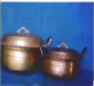
เครื่องทองเหลือง

4. ผลิตภัณฑ์ประเภทเครื่องประดับตกแต่งอาวุธ เครื่องทองเหลืองประเภทนี้ช่างทองเหลืองในปัตตานี ได้เลิกผลิตไปเมื่อมีการเลิกใช้อาวุธประเภท ทอก ดาบ