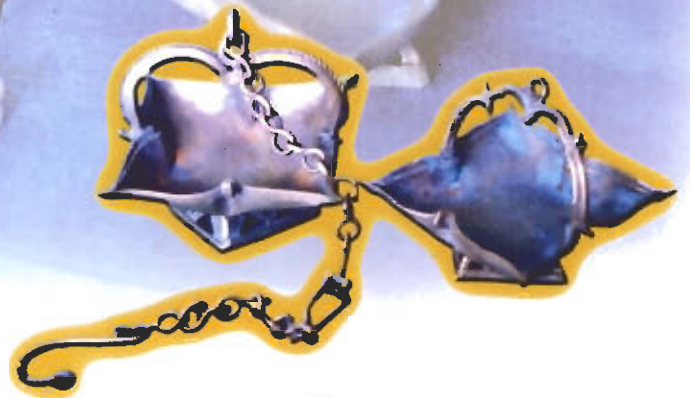
● ตะเกียงกลีบบัว

กริช และอาวุธปืนไฟประเภทปืนคาบศิลาและปืนแก๊ป โดยเฉพาะ ทอก ดาบ และกริชนั้นได้เลิกใช้ไปก่อน เป็นเวลานาน การผลิตเครื่องประดับสำหรับตกแต่ง อาวุธเหล่านี้จึงเลิกไปพร้อม ๆ กับการเลิกใช้อาวุธ เหล่านี้ไปจากวิถีชีวิตประจำวัน เครื่องตกแต่งอาวุธ เหล่านี้ได้แก่ ปลอกทอก ดอเกี๊ยะกริช โกร่งโกบ คาบศิลาและปืนแก๊ป เป็นต้น