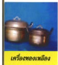
เครื่องทองเหลือง

พลาสติกและสแตนเลสที่ผลิตจากโรงงานมากขึ้นผลิตภัณฑ์เหล่านี้มีหลายรูปแบบและราคาย่อมเยาความนิยมผลิตภัณฑ์เครื่องทองเหลืองจึงลดน้อยลงไปตามลำดับ ช่างทองเหลืองบางครอบครัวจึงต้องเปลี่ยนอาชีพใหม่ การทำเครื่องทองเหลืองในระยะนั้นจึงเหลือผู้ประกอบอาชีพเพียง 4-5 ราย และในช่วงปี พ.ศ. 2540 มีผู้ประกอบอาชีพเหลือเพียงรายเดียวถือได้ว่าเป็นยุคสุดท้ายของเครื่องทองเหลืองเมืองปัตตานี