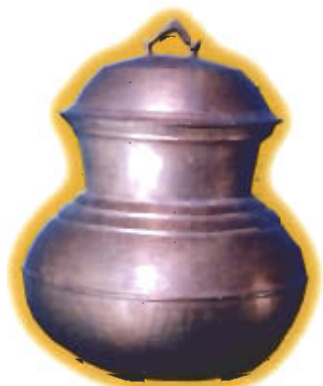
● หม้อคอ หม้อคออม

ประโยชน์ใช้สอย ใช้เป็นหม้อสำหรับหุงข้าว หม้อน้ำมนต์หรือ หม้อน้ำศักดิ์สิทธิ์ มีหลายขนาด จัดเป็นหม้อทองเหลืองรุ่นเก่าแก่ที่มีใช้กันมาก่อนหม้อทองเหลืองชนิดปากกว้าง หม้อชนิดนี้น่าจะได้รับรูปแบบมาจากหม้อดินเผาโบราณที่มีใช้กันทั่วไปในท้องถิ่นเป็นที่น่าสังเกตว่าหม้อทองเหลืองลักษณะนี้มีใช้กันอยู่ในอินเดียและในเขมรด้วย