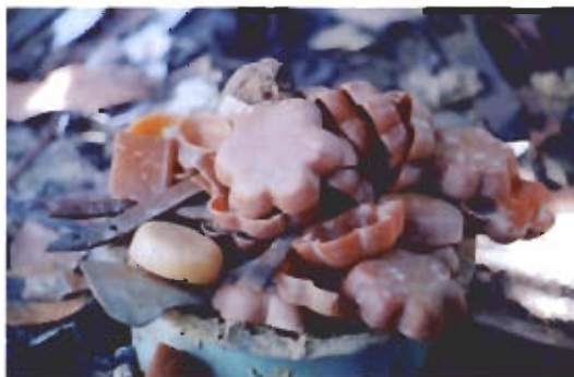
● แม่ขี้ผึ้งก็ได้หล่อเตรียมเอาไว้สำหรับทำ แม่พิมพ์บนบ่อเปิดในขั้นตอนนี้ต่อไป