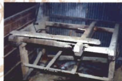
● เครื่องอบแห้งกลิ้งสำหรับใช้กลิ้งแกนดินเหนียวและกลิ้งขึ้นของซีเมนต์ที่จะทำเป็นแม่พิมพ์ชิ้นงาน