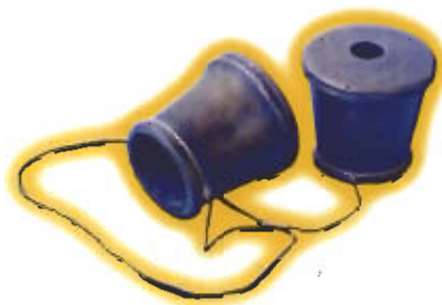
● ปลอกสวมเขาวัวชน

ประโยชน์ใช้สอย ใช้สวมเขาวัวชนเมื่อพาไปฝึกซ้อมหรือขณะเดินทางไกลหรือวิ่งหรือพาไปบ่อนซึ่งวัวบางตัวจะคุมมากอาจจะเข้าทำร้ายหรือกัดคนข้างเคียงและเจ้าของได้ การสวมปลอกเขาให้กับวัวจะช่วยป้องกันอันตรายจากปลายที่แหลมคมของเขาวัวได้มากที่สุดทีเดียว