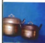
เครื่องทองเหลือง