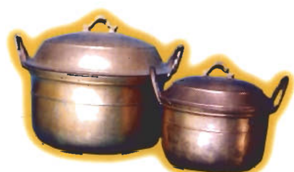
● หม้อหู หม้อปากกว้าง หม้อตานี

ประโยชน์ใช้สอย ใช้เป็นหม้อสำหรับหุงข้าว หรือใช้เป็นหม้อแกงประเภทต่าง ๆ ที่ไม่ใช่ประเภทแกงส้ม (เพราะว่ากรดในส้มจะทำให้โลหะทองเหลืองละลายออกมาทำให้รสชาติของแกงเปลี่ยนไปมีรสขมและมีธาตุโลหะหนักเจือปนออกมาในน้ำแกง) หม้อชนิดนี้มีหลายขนาด ขนาดเล็กที่สุดจะมีความจุประมาณหนึ่งลิตร ขนาดใหญ่ที่สุดจะมีความจุประมาณหกถึงแปดลิตรเป็นหม้อทองเหลืองที่คนในภาคใต้ในอดีตนิยมใช้และพบมากกว่าเครื่องทองเหลืองประเภทอื่นๆ