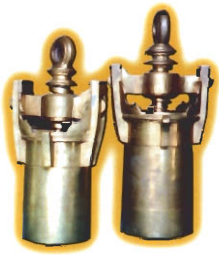
● กระบอกอัดเส้นชนมจีน

ประโยชน์ใช้สอย ใช้อัดเส้นหรือรีดชนมจีน เป็น ศิลปกรรมรูปแบบภาคใต้สันนิษฐานว่าเกิดขึ้นที่เมือง นครศรีธรรมราชก่อนแล้วแพร่หลายมายังภาคใต้ ตอนล่าง เมืองปัตตานีจึงรับเอารูปแบบไปผลิตต่อ และยังคงเรียกผลิตภัณฑ์ชิ้นนี้ว่า “กาเบ๊าะ” ตาม สำเนียงมลายูท้องถิ่นที่เพี้ยนมาจากคำว่า “กระบอก”